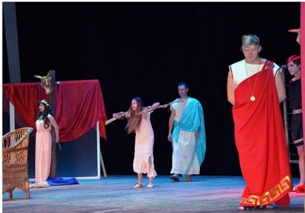
Спектакль «Мессалина: жена цезаря вне подозрений» театра драмы «Психо Дель Арт»