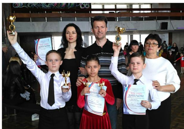
Образцовый ансамбль бального танца «Мириданс». Региональный фестиваль «Весна Победы» (г. Керчь)