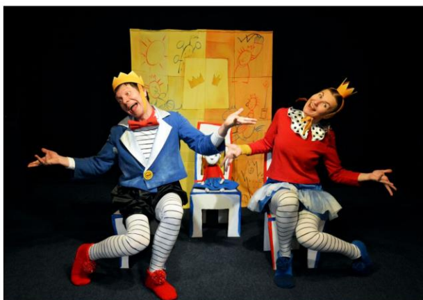
Открытие III театрального сезона в Театре имени Кукол спектакль «Королевская игра»