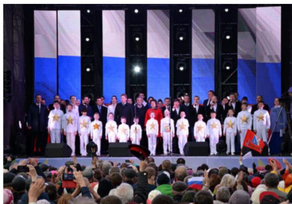
Концерт, посвященный 3 - й годовщине «Крымской весны» на площади П.С. Нахимова