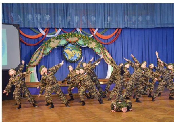
Спортивный праздник «Мы выбираем спорт»