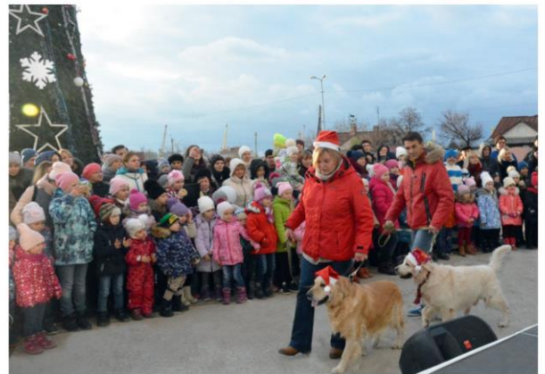
Народное гулянье «Сверкай огнями, ёлка!» на площади КИЦ