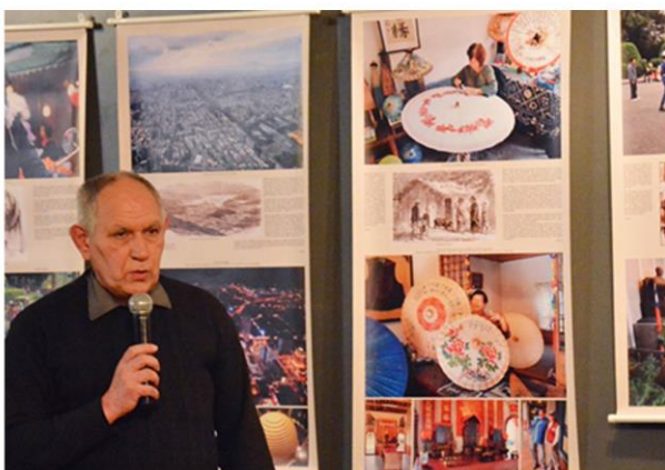
Выставка «Экскурсия на Формозу. Незабываемые герои»