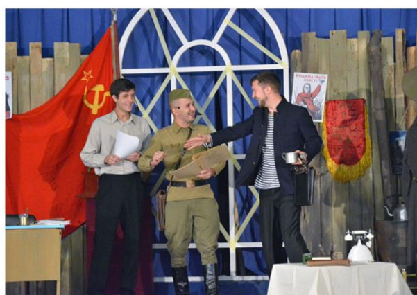
Литературно-музыкальная гостиная, посвященная поэтам, писателям и военным корреспондентам, участникам боев за Севастополь в годы Великой Отечественной войны