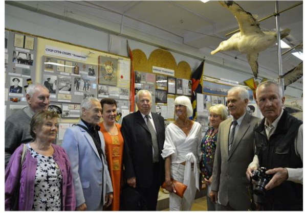
Ветераны рыбной отрасли на экскурсии в музее рыбаков