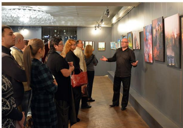
Выставка молодых художников «Ренессанс реальности»