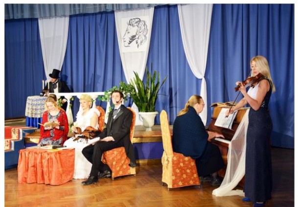
Литературно-музыкальная гостиная «Пока в России Пушкин длится, метелям не задуть свечу»