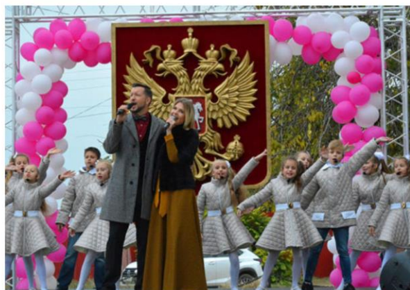
Иммерсивная программа «В единстве наша сила!» ко Дню народного единства