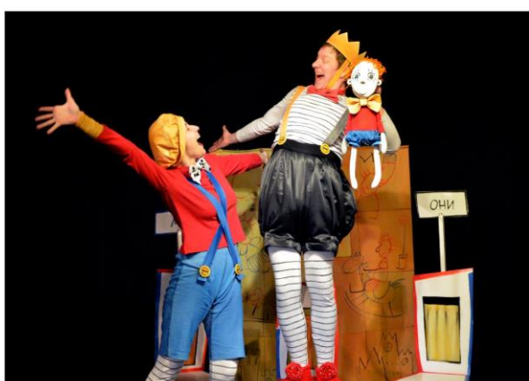
Театр имени Кукол КИЦ на Международном фестивале театров кукол «Сказочный мир» (г. Донецк)