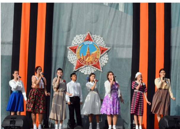
Фестиваль «Ради жизни на земле»