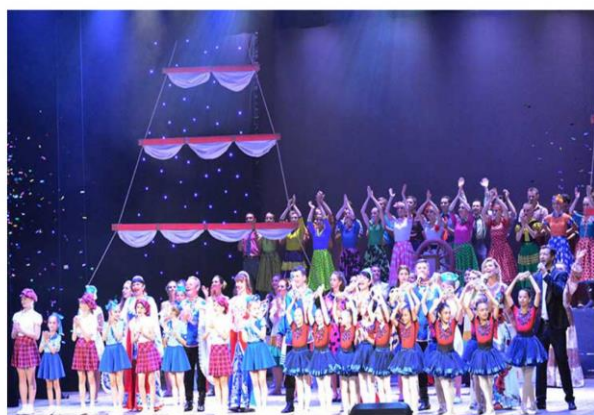
Праздничный концерт ко Дню рыбака