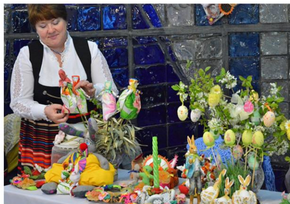
Выставка декоративно-прикладного искусства «Пасхальные узоры»