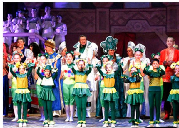
Музыкальная сказка «Царевна - лягушка»