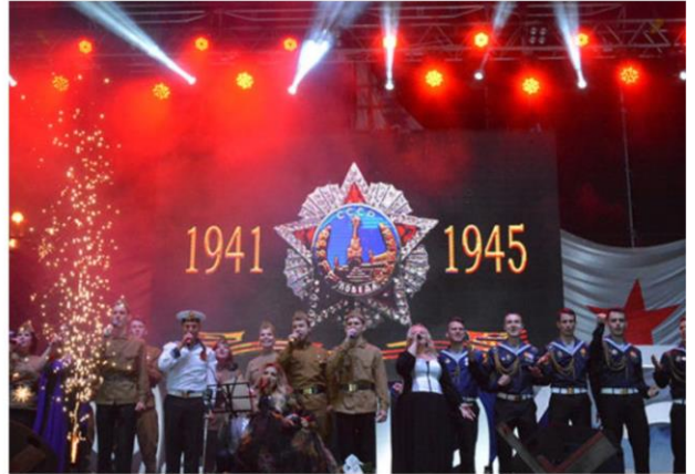
Театрализованно-музыкальный проект «Этот День Победы» на площади П.С. Нахимова