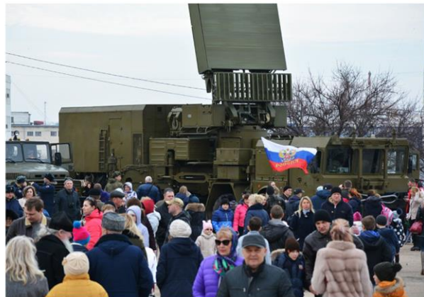
Выставка военной техники на площади КИЦ и праздничный концерт к Дню защитника Отечества