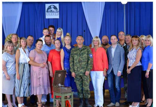
Семинар-практикум для руководителей учреждений культуры и тематическая программа «Удивительная история граммофона»