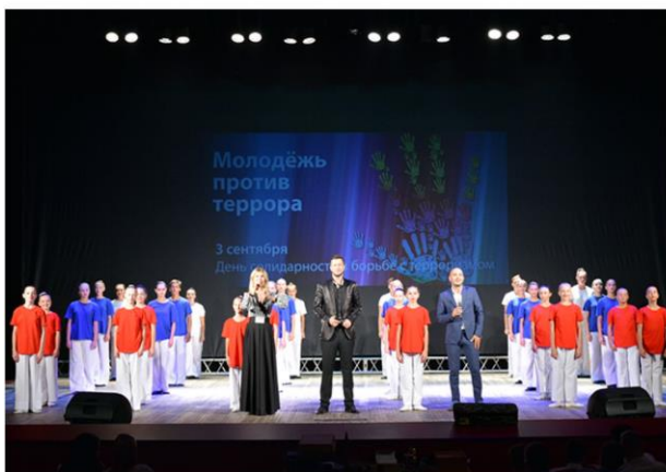
Тематический час «Вместе против террора» ко Дню солидарности в борьбе с терроризмом