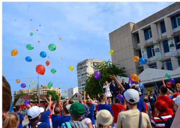
Праздничная программа к Международному Дню защиты детей на площади КИЦ