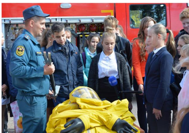
Тематическая программа к 85 - летию войск гражданской обороны МЧС России