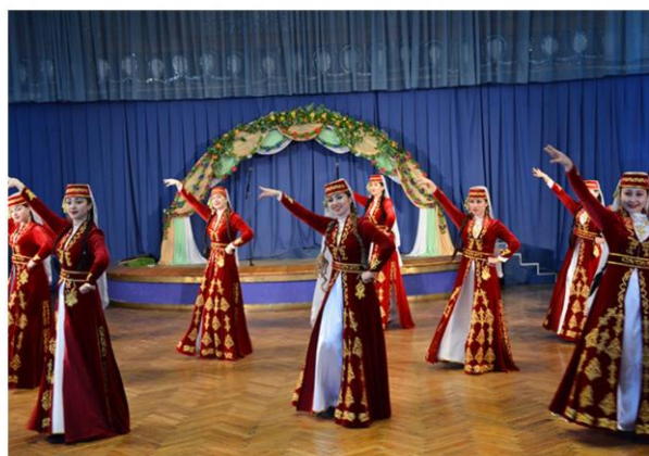
Тематическая программа «Навруз-байрам - праздник весны»