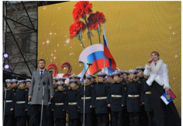
Концерт- акция к Дню защитника Отечества площадь им. П.С.Нахимова