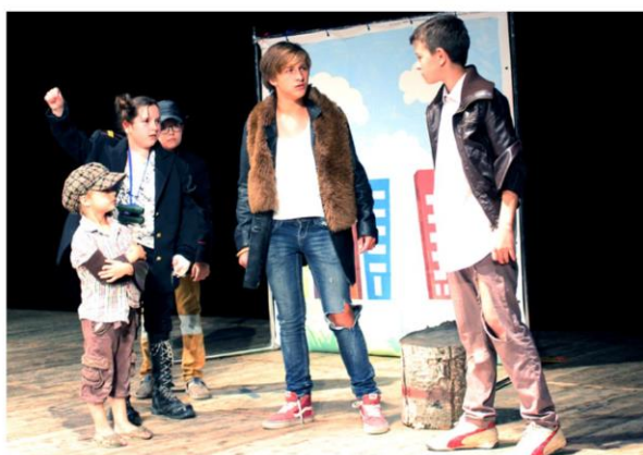
Фестиваль малых театральных форм «Закрытый покаZ»