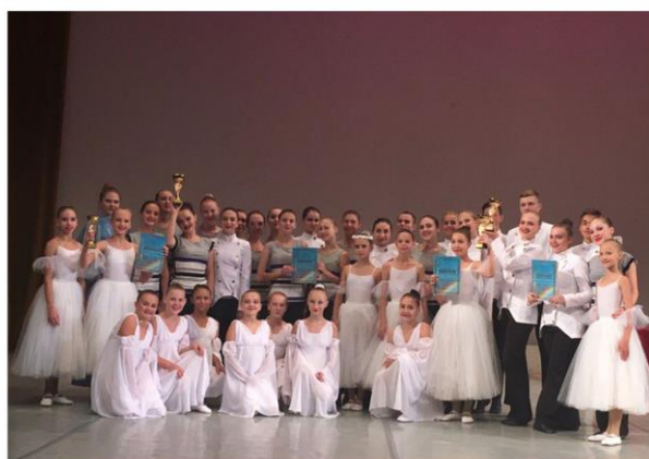
Победители международного конкурса-фестиваля детского и молодёжного творчества «Преображение» (г. Санкт - Петербург), образцовый хореографический ансамбль «Атлантика»