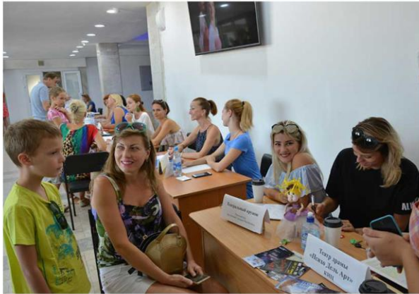
День открытых дверей «Открой свои таланты в КИЦ!»