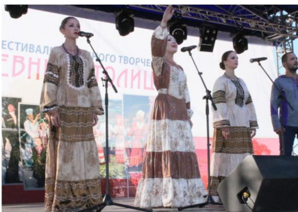
Международный фестиваль народного творчества «Наши древние столицы» (г. Кострома). Народный ансамбль традиционной культуры «Марьины кудесы»