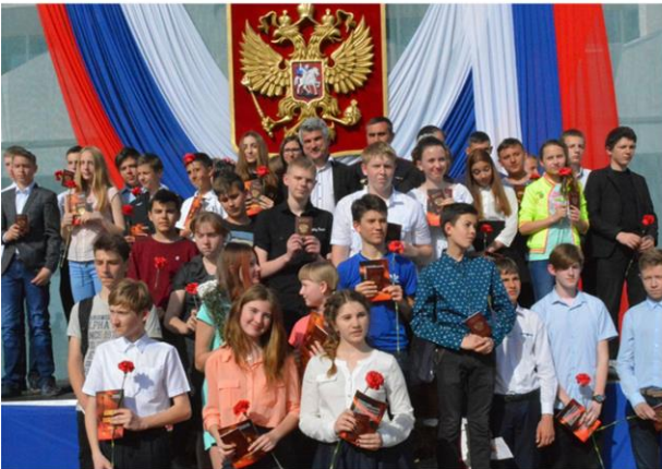
Праздничный концерт и торжественная церемония вручения паспортов