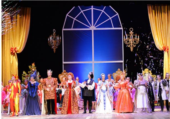
Губернаторская елка для одаренных детей