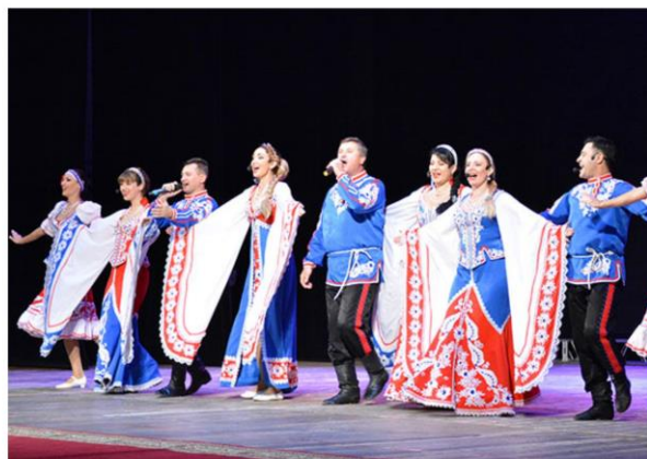
Праздничный концерт «С днем рождения, родной Гагаринский район!»