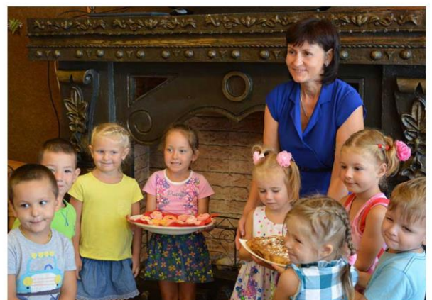
Праздничная программа ко Дню рождения Чебурашки