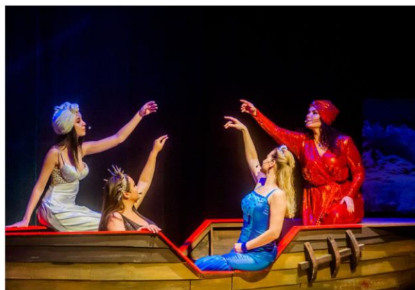
Всероссийская культурно-образовательная акция «Ночь искусств»