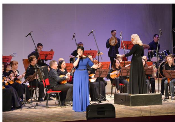
Музыкальный лекторий для учащихся севастопольских школ «Секреты звонких струн»