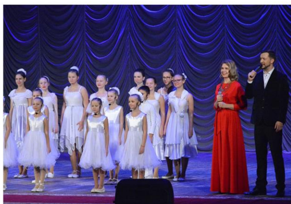
День Героев Отечества Встреча поколений «Традиции ветеранов - молодежи в наследство»