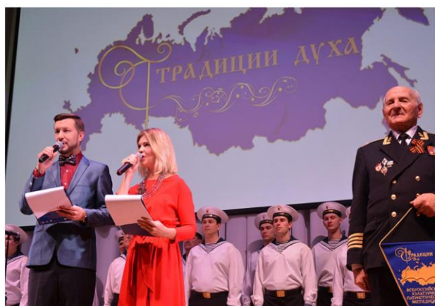
Торжественное открытие фестиваля «Традиции Духа» в филиале Нахимовского военно-морского училища (Севастопольского Президентского кадетского училища)