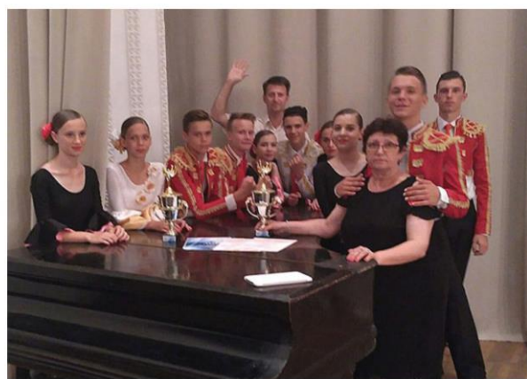
Победа ансамбля бального танца «Мириданс» в Международном фестивале-конкурсе «Поитийские игрища» (г. Керчь)