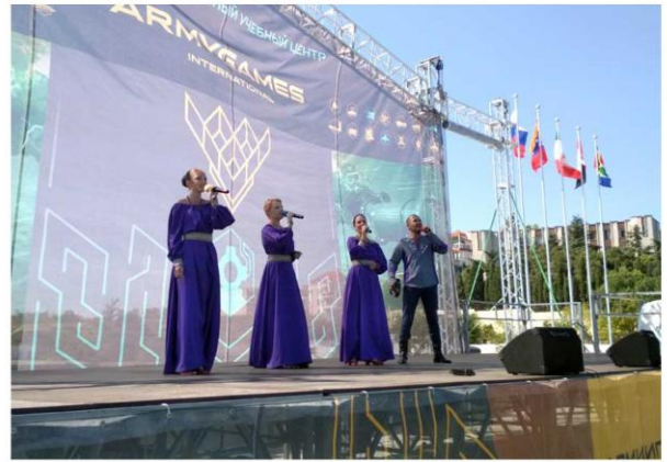
Культурная программа по обеспечению Международного конкурса по водолазному многоборью «Глубина - 2017»