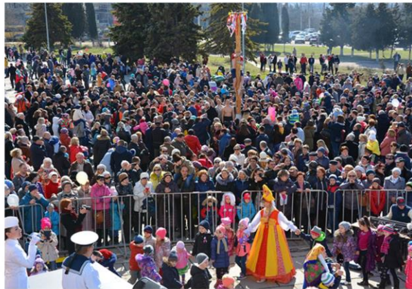
Народное гулянье «Масленица по – флотски»