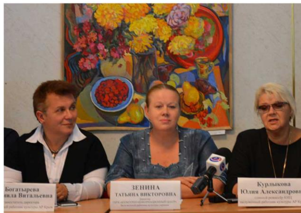
Пресс-конференция, посвященная открытию нового творческого сезона