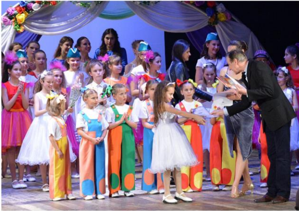
Отчетные концерты творческих коллективов