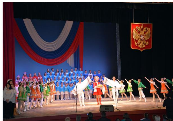
Праздничный концерт «В единстве наша сила»