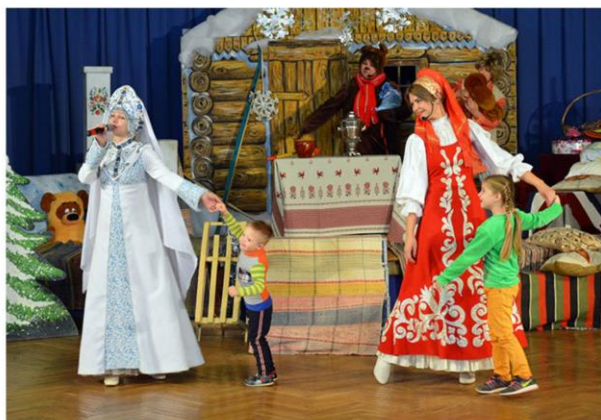
Театрализованная программа «С днем рождения, Дед Мороз!»