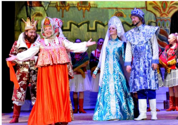
Премьера спектакля «Чудо-Юдо и все, все, все!»