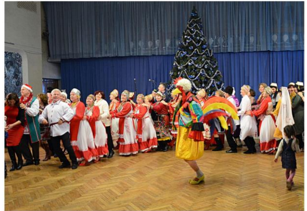
Тематический вечер «Зимние праздники народов Крыма»