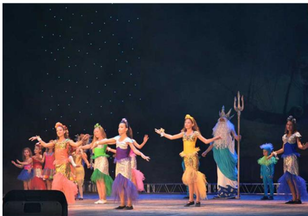
Концертная программа «Шаг в мир искусства»