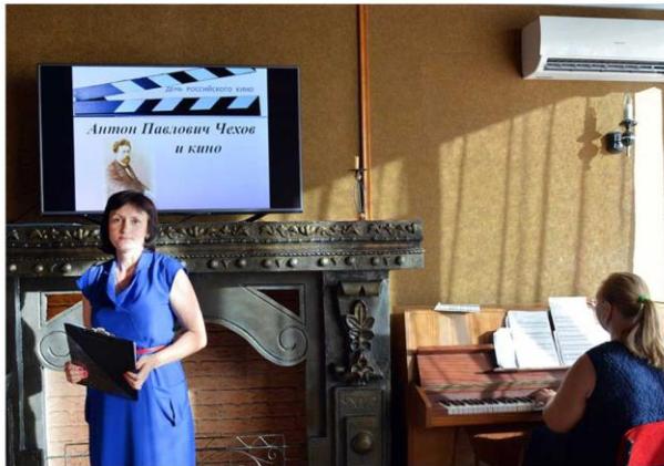
Литературный кинозал «Со страницы - на экран»