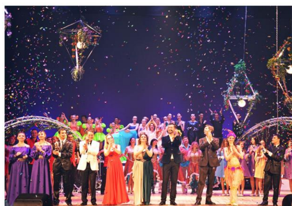
Шоу – программа «Весной был полон сад...»