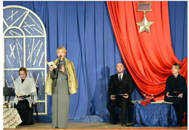
Урок мужества «Ленинградский дневник»