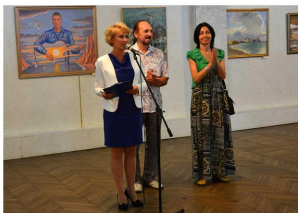
Выставка живописных работ севастопольских художников, посвященная Дню рыбака