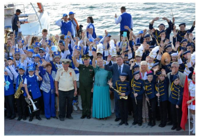
II Международный фестиваль духовой музыки «Севастопольский вальс»