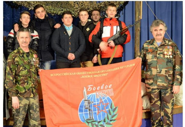
Час истории, посвященный 28-ой годовщине вывода советских войск из Афганистана