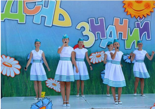
Праздничная программа «Здравствуй, школьная пора!» на площади КИЦ