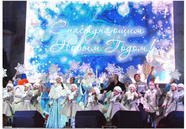
Концертная программа и открытие главной новогодней ёлки на площади имени П.С. Нахимова