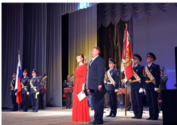
Праздничный концерт ко Дню войск национальной гвардии Российской Федерации