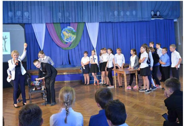
Экологическая программа «Дорогу осилит идущий»