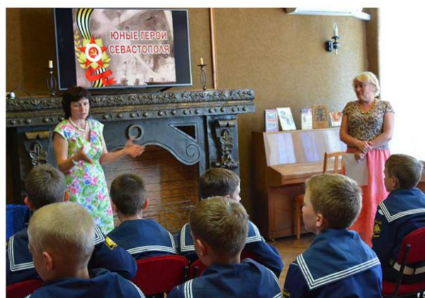
Тематический час, посвященный подвигам юных героев Севастополя в годы Великой Отечественной войны