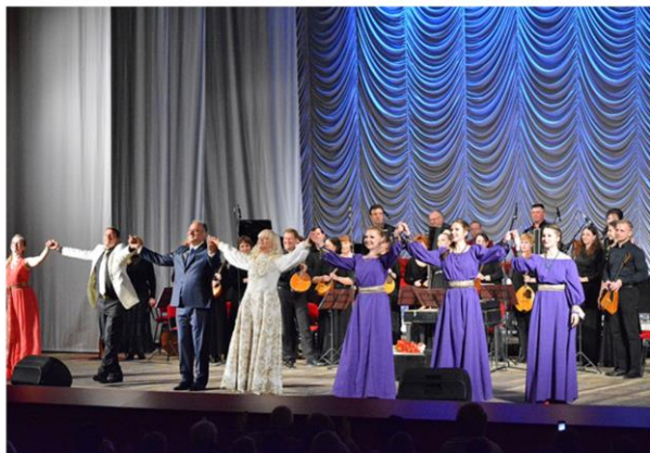
Музыкальная программа «Апрельская капель»