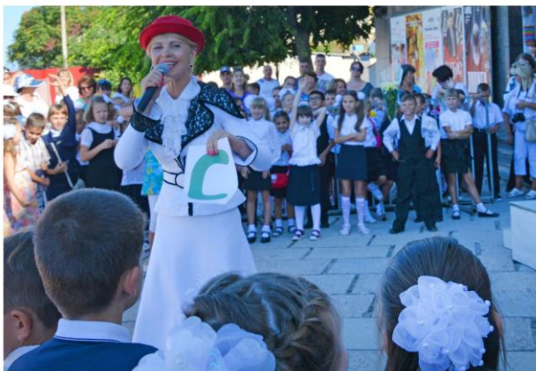
Познавательно-развлекательная программа «Мы славим тебя, родной Севастополь»