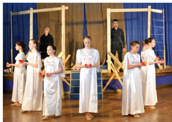
Урок мужества «Дорогой подвига и бессмертия»