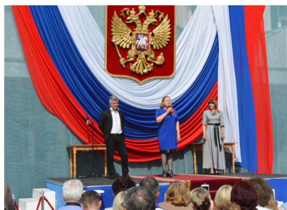
Праздничная программа ко Дню России