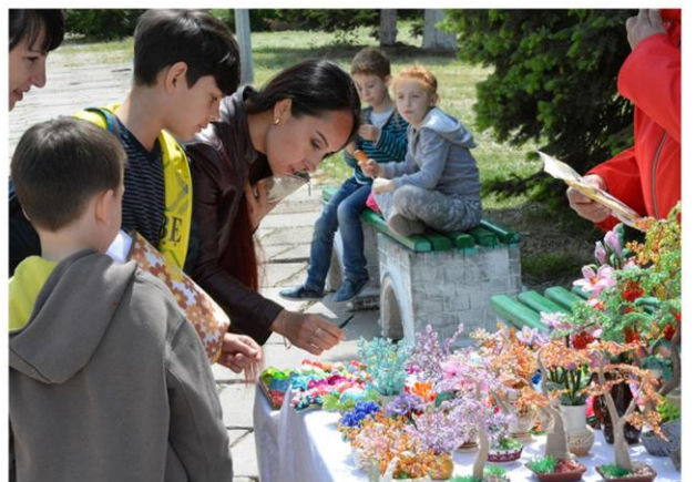
Фестиваль «Славянские родники»