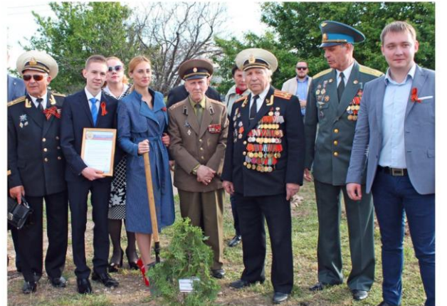
Патриотическая акция «Лес Победы»