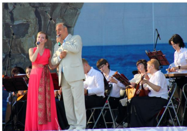
Праздничный концерт «Я люблю, тебя Россия!» на площади П.С. Нахимова