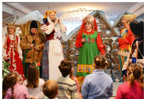
Праздничная программа «Веселое Рождество»