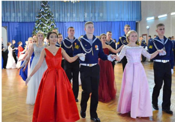
Зимний бал курсантов Черноморского высшего военно-морского училища им. П.С.Нахимова