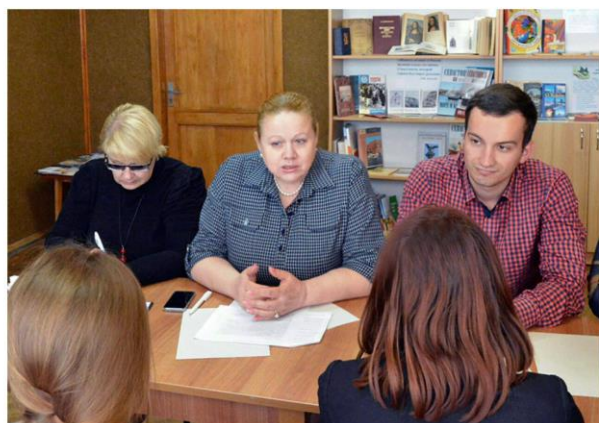
Творческая встреча с представителями молодежных организаций города